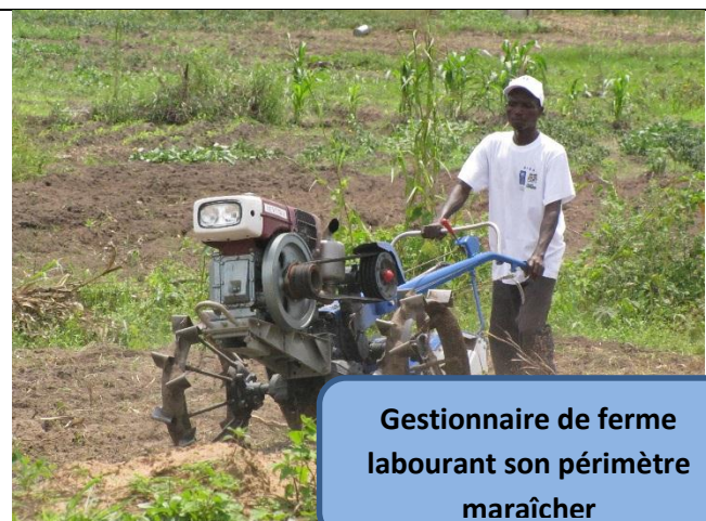
Gestionnaire de ferme labourant son périmètre maraîcher