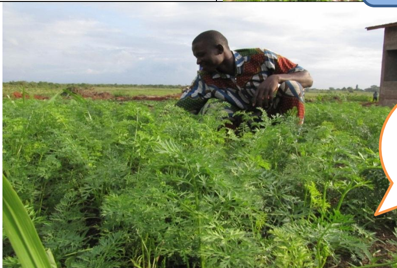
Gestionnaire de ferme sur son périmètre maraîcher