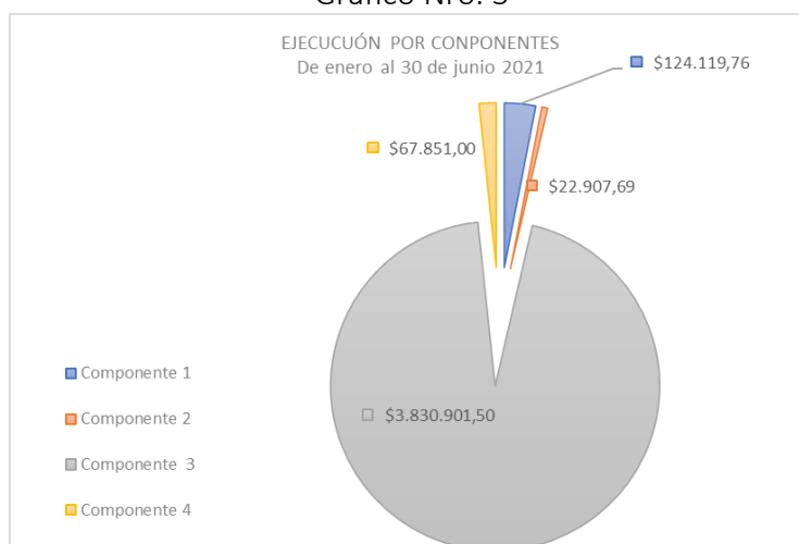
Gráfico Nro. 3

Adicional a estos montos ya ejecutados, existen órdenes de compra y contratos ya firmados, con lo que sus respectivos presupuestos están en estatus de comprometido, es decir, con contratos firmados y a la espera de que culmine su fabricación y entrega en las bodegas de la EEQ, para proceder a cancelar y cerrar los contratos.