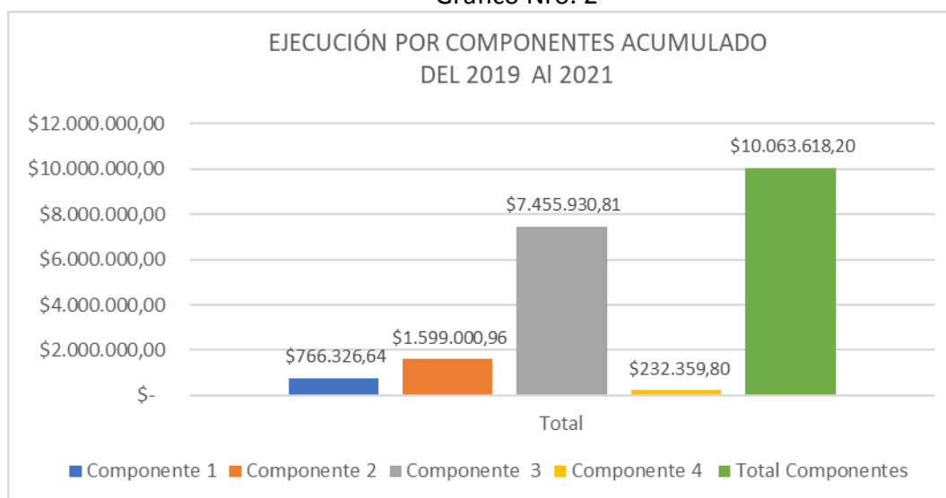
Gráfico Nro. 2