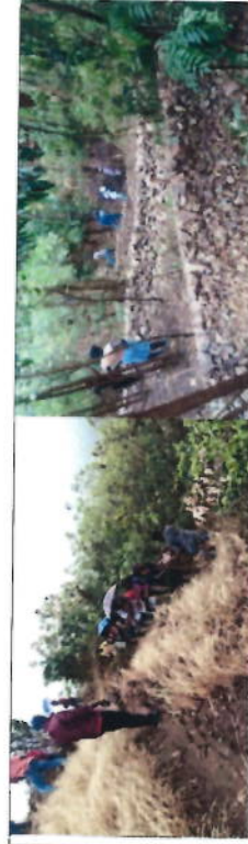
Equipe au travail de construction des seuils en pierres sèches

G. Documents justificatifs : le Bénéficiaire doit joindre des documents justificatifs supplémentaires et/ou des photos