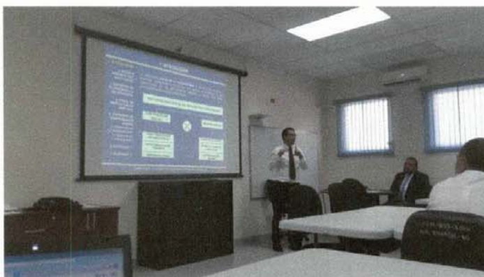
Taller sobre impacto social en obras de infraestructura vial Sesión con especialistas MOPTVDU Octubre 2015