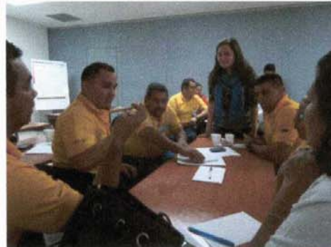
Sesiones de formación al MOPTVDU en “Transversalización del enfoque de género” 9, 10, 11 y 12 de noviembre de 2015