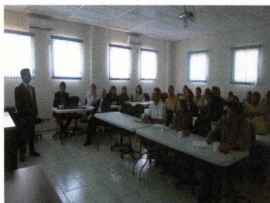
Presentación resultados de consultoría de Medición de Impactos en la Construcción de Caminos Rurales, MOPTVDU 30 de Septiembre de 2015

Producto 2: Ministerio de Obras Públicas fortalecido en su capacidad institucional para ejecutar las obras de infraestructura a través de procesos de formación y entrenamiento de personal.