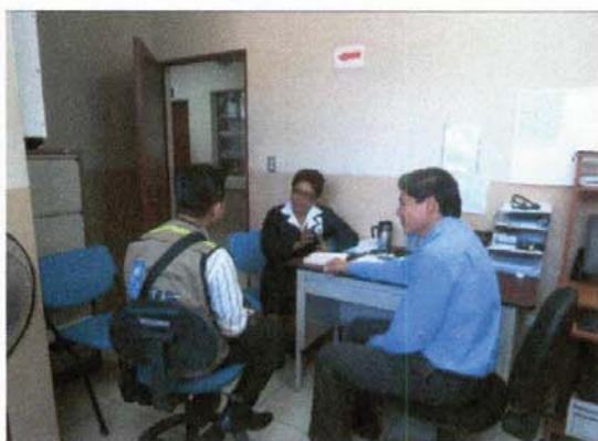
Jornada de entrevistas de campo de la consultoría "Medición de Impactos en la construcción de Caminos Rurales" Unidad de Salud de Tamanique 24 de febrero de 2015