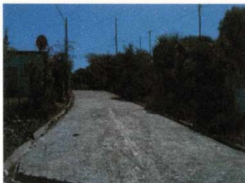
Descargas de mampostería y empedrados fraguados con drenaje superficial San Julián, Sonsonate, Enero de 2015