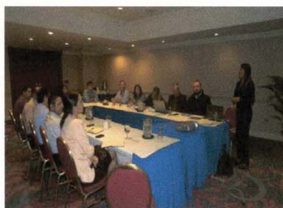
Taller de inducción funcionamiento proyectos NIM PNUD Funcionarios de CEPA Noviembre 2015