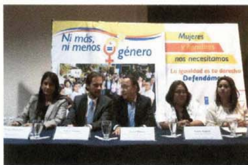
Lanzamiento de la Política Ministerial de Género del MOPTVDU Mesa de Honor: ONUMJERES, PNUD, MOPTVDU, ISDEMU 3 de Diciembre de 2015