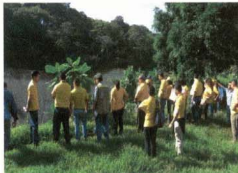
Taller de formulación de proyectos incluyendo temática de adaptación al cambio climático Visita a sitio obra Bosques de Prusia Sesión 2, 11 de diciembre 2015