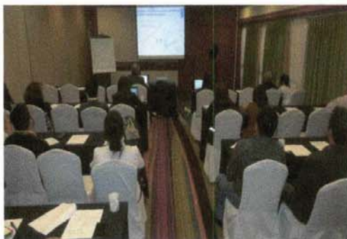
Taller de formulación de proyectos incluyendo temática de adaptación al cambio climático Exposición Área de Resiliencia PNUD Sesión 1, 10 de diciembre 2015