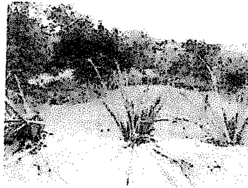
Photo 2 ananas en fruits