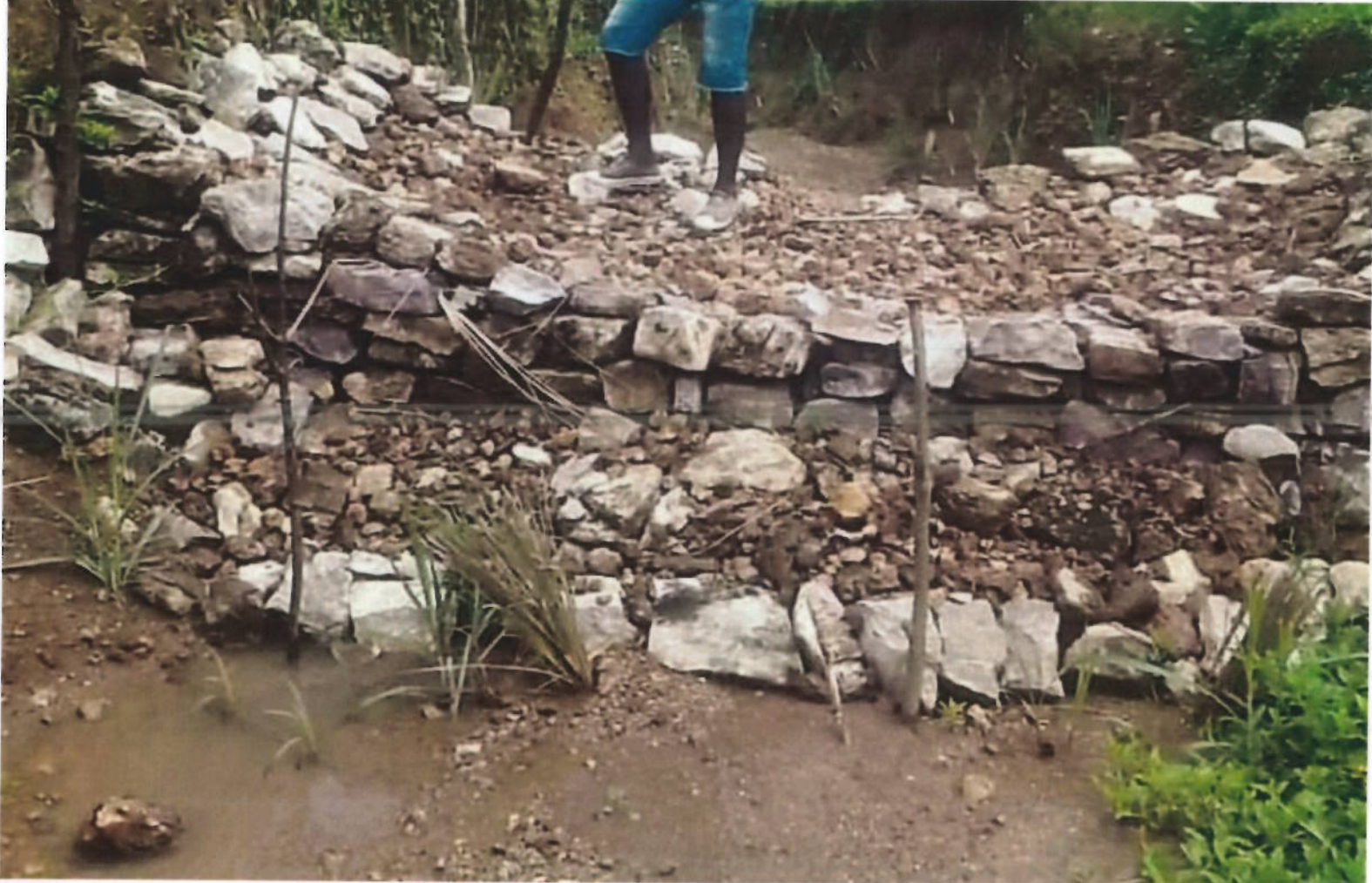
Seuil en pierre sèche dans les ravines