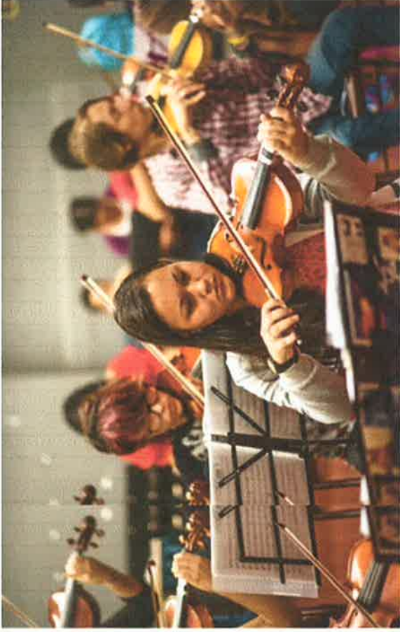
La Fundación Musical Schola Cantorum, en Venezuela.

Esta forma se busca mejorar la calidad de vida y reducir la desigualdad, además de promover la profesionalización de los participantes, tanto profesores como alumnos. El proyecto asegura la dotación y modernización de los instrumentos, equipos y espacios que permitan los más altos niveles de excelencia en el desempeño.